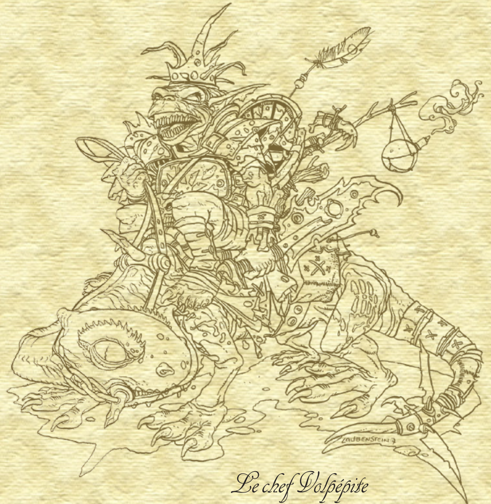
Le chef Vospépise

Bien que ne faisant pas partie à proprement parler des gobelins, il convient de citer ici Bruthazmus, un gobelours qui vit dans le nord du Bois aux Orties mais visite fréquemment les cinq tribus pour troquer les biens qu'il vole aux caravanes marchandes. Ce gobelours nourrit une haine particulièrement féroce envers les elfes; je l'ai d'ailleurs combattu à de nombreuses reprises.