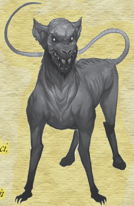
Un chien gobelin

5. Les gobelins sont sournois. Un gobelin excité ou fâché fait beaucoup de bruit en jacassant des menaces et en montrant les crocs, mais peut devenir silencieux en une fraction de seconde. Ceci, combiné avec leur petite taille, les rend redoutablement doués pour se cacher là où on ne les attend pas : dans des piles de bois