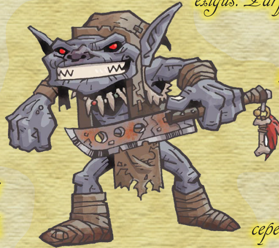
Gobelin moyen (large tête)

7. Les gobelins sont très voraces. S'il dispose d'assez de vivres, un gobelin prendra douze repas par jour. La plupart des tribus gobelines ne possèdent pas suffisamment de nourriture pour faire face à de tels appétits, ce qui explique pourquoi les gobelins se lancent constamment dans des raids.