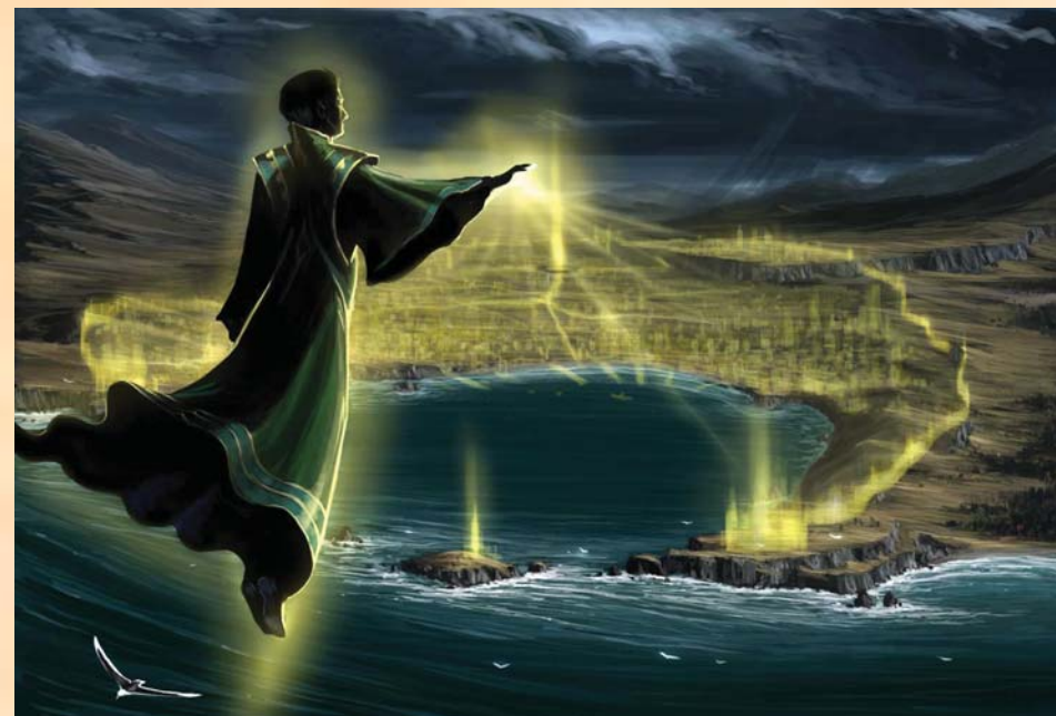
Aroden créant la ville d'Absalom