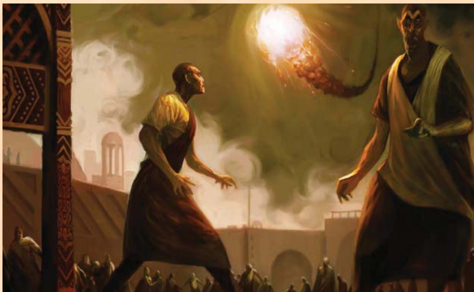
l'ancien Azlante détruit par la Chute d'Étoiles