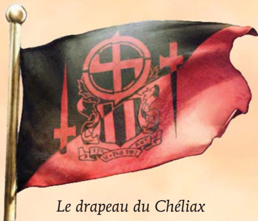
Le drapeau du Chéliax

lancèrent de nombreuses attaques contre le Taldor, un conflit qui devait durer pendant plusieurs siècles, jusqu'à aboutir à une paix plutôt ténue vers 4600 AR (une paix qui risque, encore aujourd'hui, d'être brisée à tout moment). Alors que le Taldor prêtait attention à sa frontière est, où les combats se déroulaient, le roi Aspex à la Voix Constante, roi de la colonie du Chéliax, décida de se séparer de l'empire du Taldor.