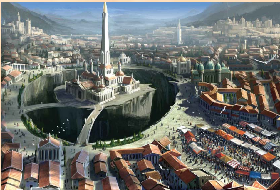
La Cathédrale de la Pierre-Étoile, à Absalom

L'île de Jalmeray. C'est également à cette époque, vers 750 AR, qu'un événement assez important se produisit à l'est des côtes du Nex, sur l'île de Jalmeray. Un voyageur venant du Vudra lointain, le maharaja Khiben-Sald, accosta sur l'île et y fit construire divers temples et écoles, important ainsi pour la première fois vers l'Avistan les mystérieuses coutumes et la non-moins-mystérieuse religion vudranaises. Quelques décennies plus tard, l'expédition vudranaise quitta l'île, qui passa entre diverses mains. Des rajahs vudranais revinrent vers 2800 AR, réclamèrent Jalmeray et réouvrirent les temples et les monastères qu'ils avaient scellés avant leur départ.