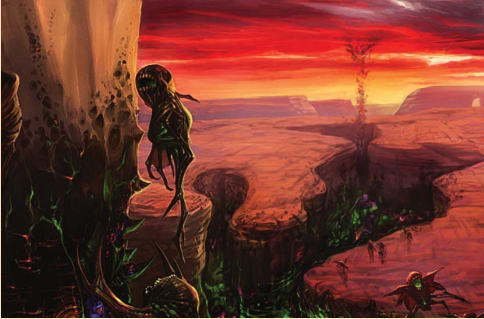
La Plaie du Monde

qui concluent des histoires introduites précédemment.