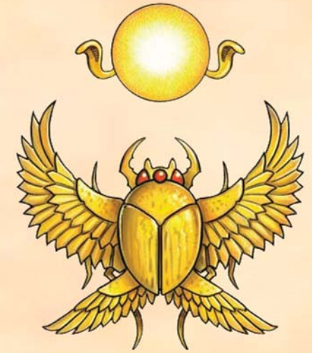
Symbole de l'Osirion

Nex et Geb. Au sud, la guerre entre Nex et Geb continuait. Le premier disparut dans des circonstances mystérieuses; certaines sources affirment qu'il s'est seulement tapi dans un endroit secret et d'autres encore qu'il a simplement changé d'identité. Le second, quant à lui, se transforma, selon les légendes, en seigneur mort-vivant et continue encore à ce jour à diriger sa nation.