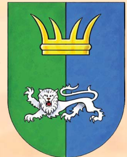
Symbole du Taldor