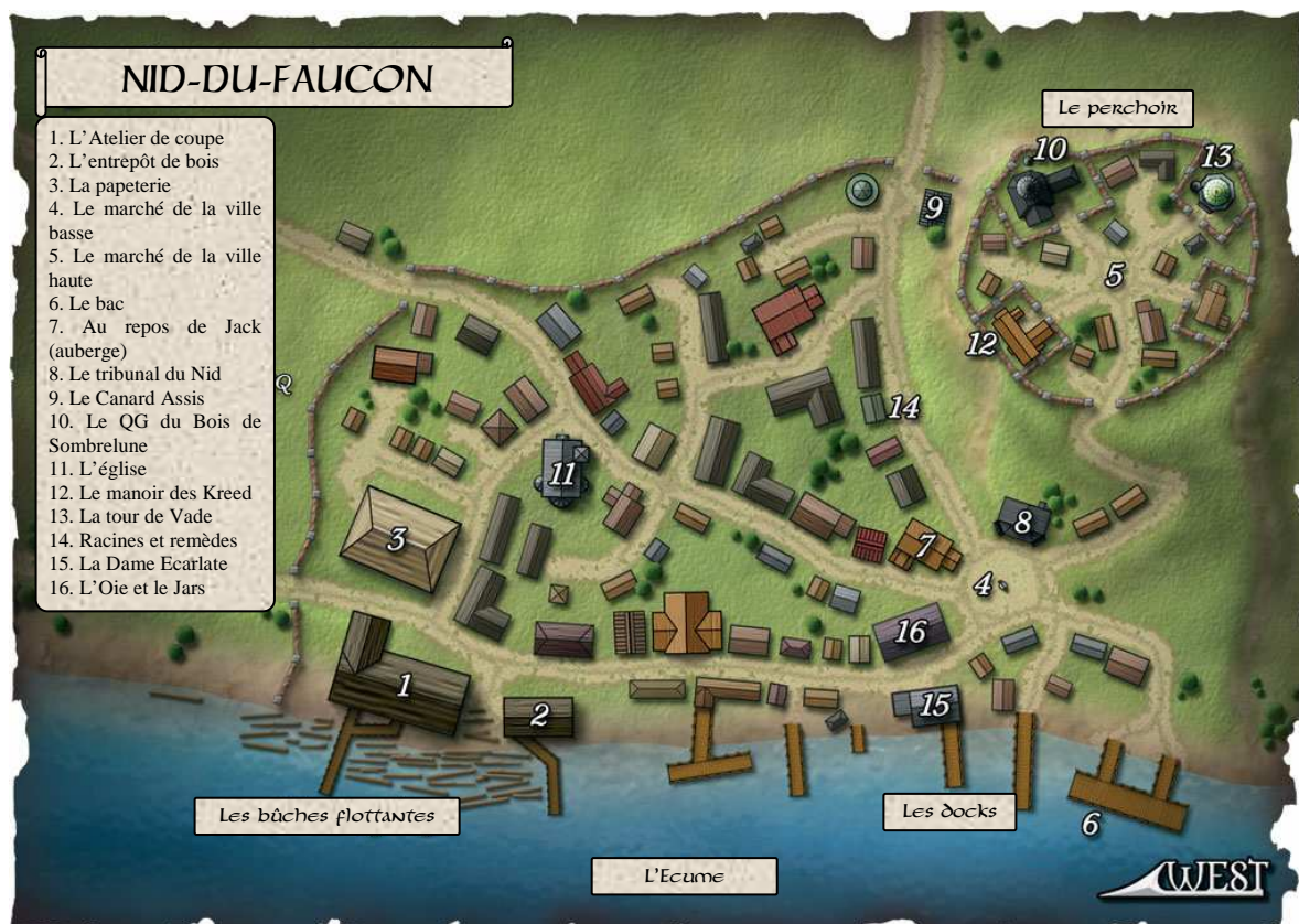
Plan du village de Nid-du-Faucon

Les personnages pourraient être impliqués dans ces histoires locales. En effet, Nid-du-Faucon se développe et des factions, que les personnages pourraient rallier, apparaissent pour tenter de créer un gouvernement officiel pour mettre un terme à l'emprise écrasante du Consortium du Bois sur le village. Les personnages pourraient être aussi impliqués dans des querelles religieuses entre diverses sectes consacrées à d'étranges divinités. Certaines sont simplement en lutte contre la théocratie classique alors que d'autres, plus maléfiques, cherchent à corrompre les âmes des habitants de Nid-du-Faucon. Enfin, le crime est une activité très lucrative dans le village et les gangs organisés, qui font preuve d'une grande imagination à ce sujet, se lancent dans de nombreuses activités illicites. Ainsi, des personnages natifs de Nid-du-Faucon devraient rapidement se trouver confrontés à un de ces gangs dans des batailles de rues avant même d'avoir eu le temps de s'aventurer dans le Val pour y chercher l'aventure et la fortune.